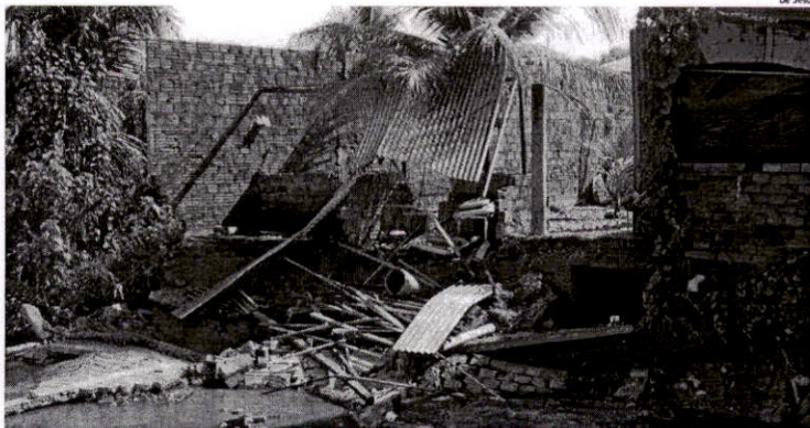
Muro de casa em área de risco, na Vila Embretel, cedeu e imóvel teve de ser isolado, assim como residências vizinhas; Defesa Civil monitora área

Para facilitar o trabalho de mapeamento e controle das áreas, técnicos da Defesa Civil visitam diariamente bairros cujas condições remetem a desenvolvimentos irregulares e sem planejamento urbano, o que favorece o acúmulo de imóveis em terrenos menos resistentes. O Es-