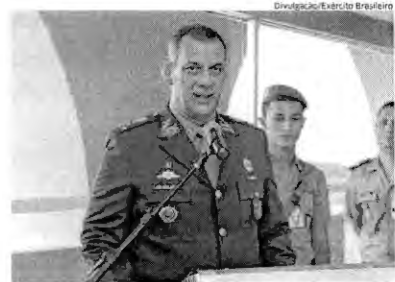
Rêgo Barros foi chefe de Comunicação Social do Exército desde 2014

Nesse ponto, o orçamento ficou com uma insuficiência de R$ 248,9 bilhões, o que significa que as despesas do dia a dia vão superar as operações de crédito nesse montante e não será possível contrair mais dívidas para quitá-las.