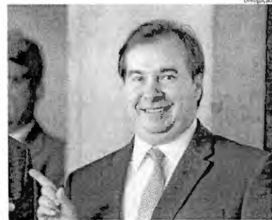
Na reta final, Rodrigo Maia costura apoios para a reeleição na Câmara

"Conseguimos o céu para o PSL, como esses caras não vão votar no Rodrigo?", declarou o líder do partido em uma conversa com jornalistas no Palácio do Planalto, fazendo referência a uma