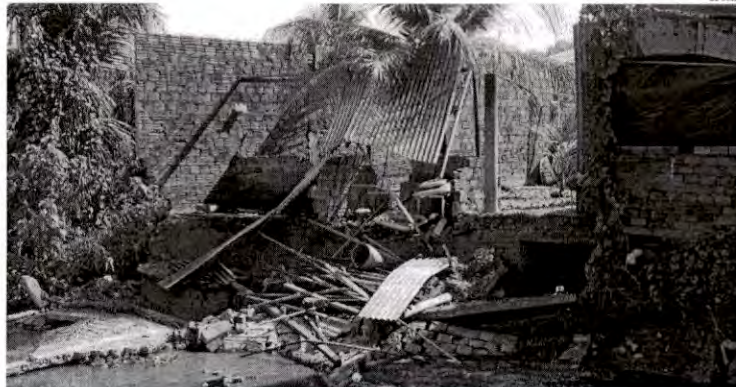
Muro de casa em área de risco, na Vila Embatrel, cedeu e imóvel teve de ser isolado, assim como residências vizinhas; Defesa Civil monitora área

Para facilitar o trabalho de mapeamento e controle das áreas, técnicos da Defesa Civil visitam diariamente bairros cujas origens remetem a desenvolvimentos irregulares e sem planejamento urbano, o que favorece o apertamento de imóveis em terrenos menos resistentes. O Es-