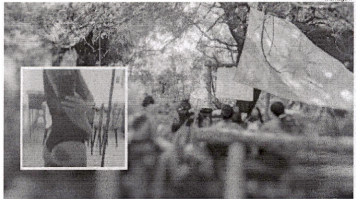
Cabo é suspeito de agredir policiais femininas durante curso promovido pela Secretaria de Segurança do Ceará

A Polícia Militar repudia veementemente qualquer desvio de conduta e/ou excesso direcionado a qualquer pessoa, praticado por policial em razão da função ou fora dela e reafirma seu compromisso com a ética, a transparência e o respeito aos direitos humanos. (Com Informações: Governo do Ceará / PC do Maranhão / PM do Tocantins)